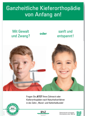
Plakat 4: Ganzheitliche Kieferorthopädie von Anfang an!