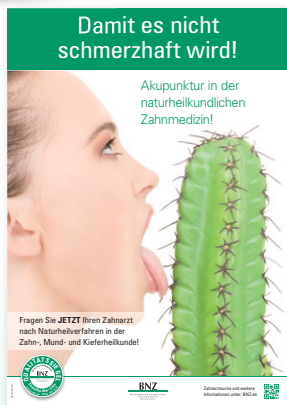
Plakat 3: Akupunktur – Damit es nicht schmerzhaft wird!