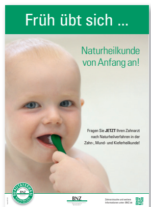
Plakat 2: Früh übt sich – Naturheilkunde von Anfang an!